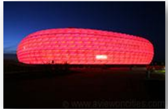
Het stadion 's avonds