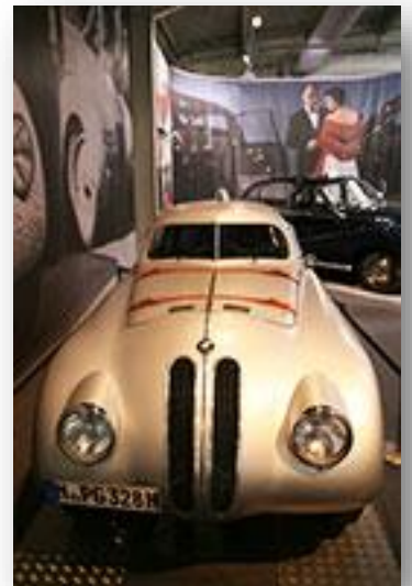
BMW 328 Mille Miglia