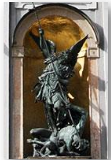
Michael verslaat Satan