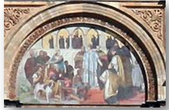
Een van de mozaïeken