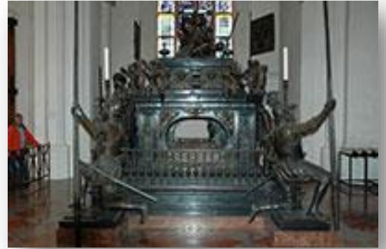
Tombe van keizer Lodewijk IV