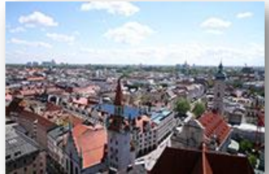
Zicht vanaf Alte Peter