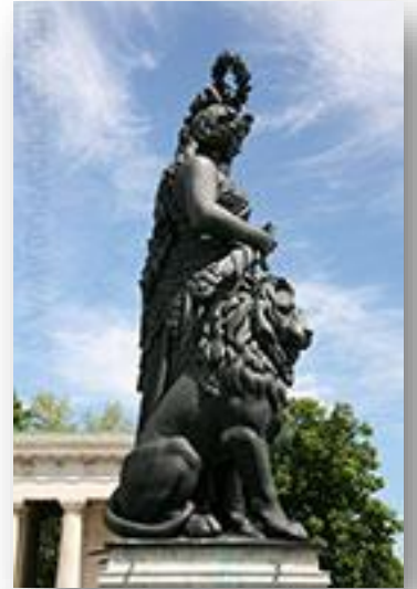
Standbeeld van Bavaria