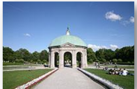
Tempel van Diana