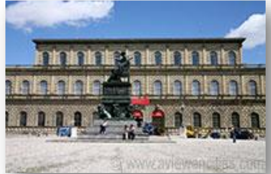
Residenz aan Max-Joseph Platz