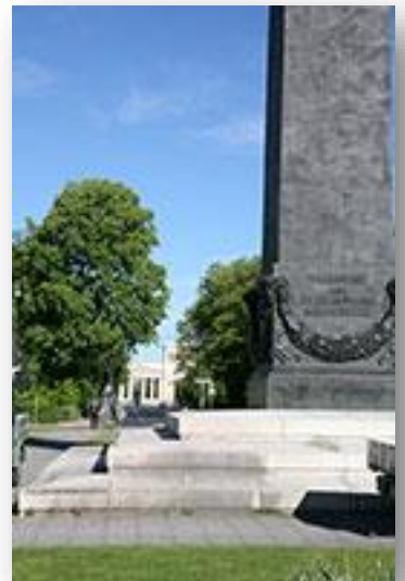
Zicht naar Königsplatz