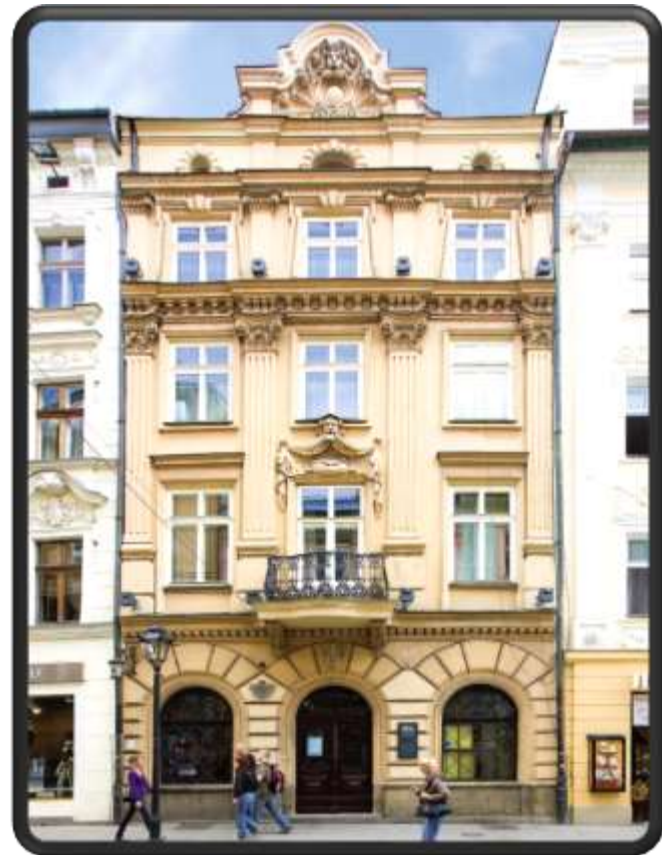
Jan Matejko huis