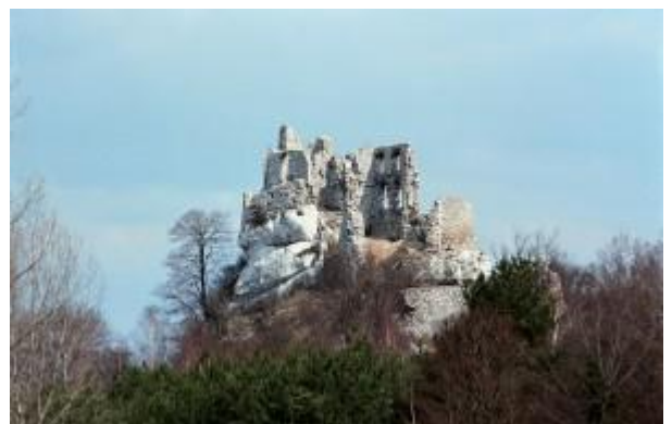
Voor de renovatie