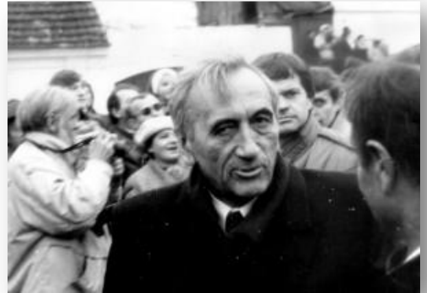
Tadeusz Mazowiecki in Krzyżowa

Het Warschaupact werd op 1 juli in Praag door de zes overgebleven leden formeel opgeheven.