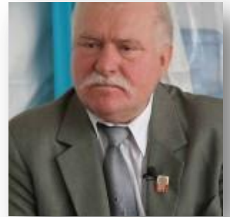
Lech Wałęsa in 2009

In sept. 1997 leverden de parlamentsverkiezingen een grote overwinning op voor de oppositionele Kiesactie Solidariteit (AWS), een coalitie van ruim 20 conservatieve, katholieke en nationalistische organisaties rondom de vakbond