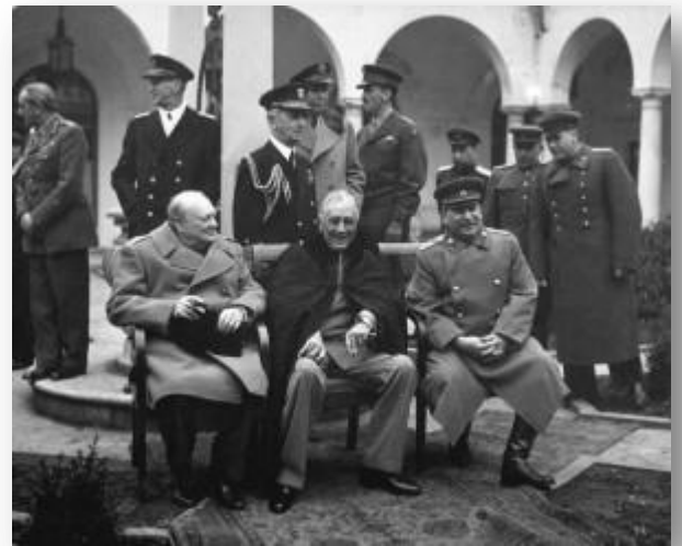
Yalta Conferentie: Churchill, Roosevelt & Stalin

Het is te danken aan het Poolse eergevoel dat zo een terugtrekking nooit heeft plaatsgevonden want het zou enorme gaten in de frontlijnen hebben gegeven en besloten werd om hun geallieerden kameraden niet in groot gevaar te brengen.