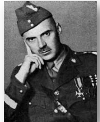
Gen. Władysław Anders

De Poolse parachute brigade van Generaal Stanislaw F. Sosabowski nam deel aan de desastreuze slag om Arnhem in Nederland. In 1945 namen de Polen de Duitse Havenstad "Wilhemshaven" in.