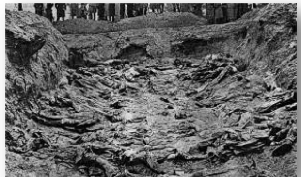
Een massagraf in Katyn, 1943