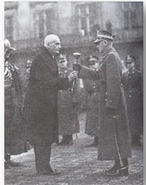
President Moscicki en Maarschalk E. Smig

Toen in 1939 Hongarije Roethenië (oostelijk Tsjechoslowakije, thans een deel van de Oekraïne) bemachtigde en daarmee de door Polen verlangde gemeenschappelijke grens met dit land had, begon de Duitse agitatie reeds dreigende vormen aan te nemen.