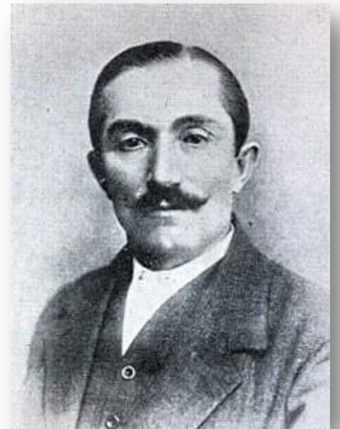
Polish Prime Minister 1920, 1923, 1926