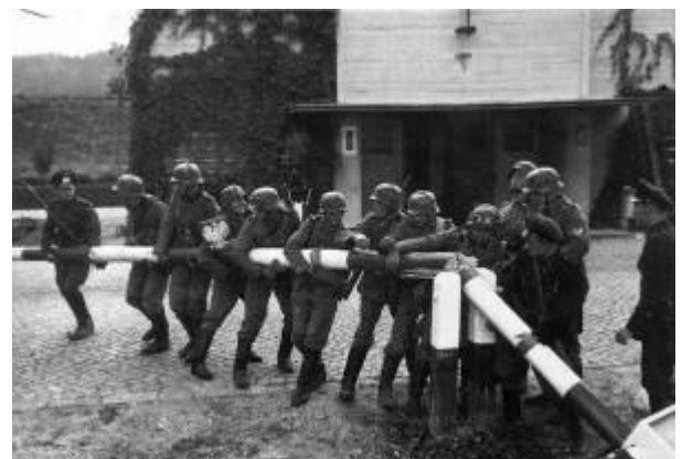
Duitse troepen vernielen een slagboom

De eis van Hitler van een corridor naar Oost-Pruisen door Polen en annexatie van Danzig werd door Polen afgewezen; het sloot een verdrag met Engeland, dat samen met Frankrijk naar de wapenen greep, nadat Duitsland op 1 sept. Polen was binnengevallen.