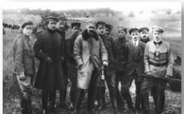
Polish Military Organisation in 1917