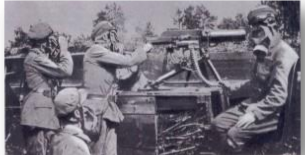
• Polish Legions II Brigade WWI in Volhy

Het zwaartepunt van de Poolse onafhankelijkheidsbeweging was nu geheel naar de Entente-landen verschoven. Het door de nationaal-democraat Dmowski gevormde Poolse Nationale Comité te Parijs verkreeg een steeds sterkere positie, vooral na de val van de tsaristische regering.