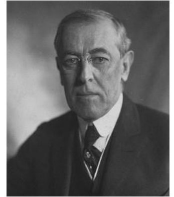
Pres. Woodrow_Wilson 1919

In het Vredesverdrag van Versailles (juni 1919) werd de grens met Duitsland slechts gedeeltelijk vastgelegd; m.n. in Oost-Pruisen en Opper-Silezië moesten volkstemmingen worden gehouden, die over de staatkundige toekomst van de betrokken landstreken zouden beslissen.