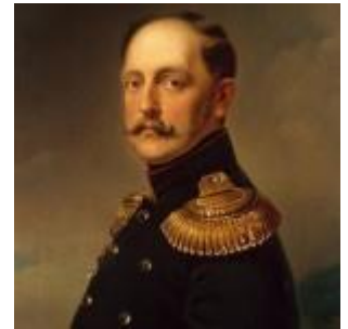
Tsaar Nicholas I

De revolutionairen waren onderling zeer verdeeld. Frankrijk, Engeland en Oostenrijk zonden protestnota's, terwijl Pruisen met de Russen samenwerkte ter