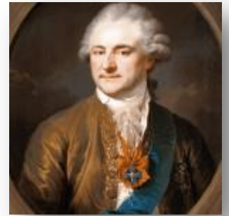
Stanislaw Augustus Poniatowski

Het jaar daarop (1795) werd wat er nog van Polen overgebleven was bij de Derde Poolse Deling door de drie aangrenzende mogendheden geannexeerd.