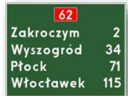
Bord E-14: afstandenbord niet-snelweg.