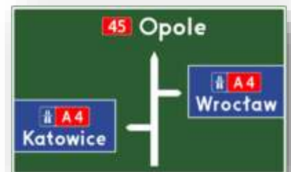
Bord E-1b: verwijzing autosnelweg.