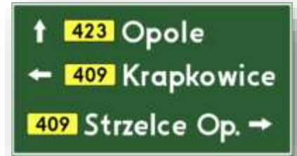
Bord E-2a: handwegwijzer.