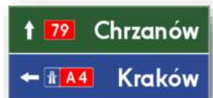
Bord E-2e: verwijzing autosnelweg.