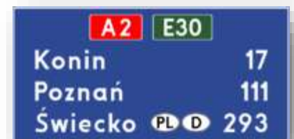
Bord E-14a: afstandenbord snelweg.